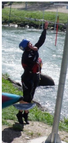
Bild: die hohe Kunst der Tor - Position